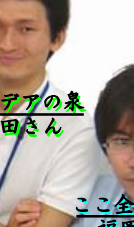
ここ全角やで!! 福岡さん