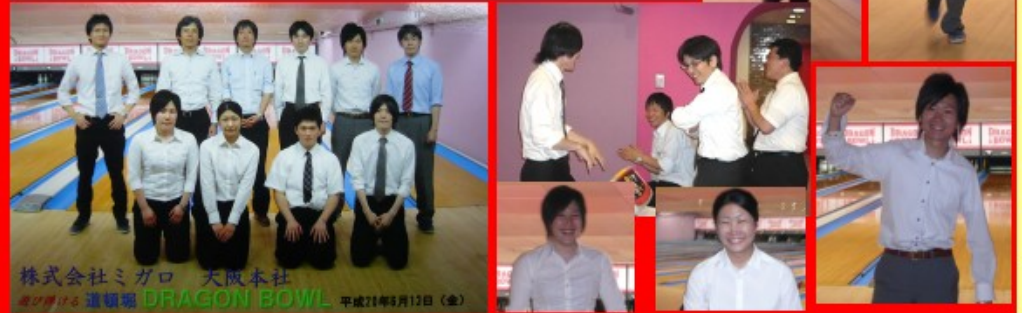
株式会社ミガロ 大阪本社 2010年12月12日(金) DRAGON BOWL

あの「Let'sクリエイション☆」が今年度リニューアルしました！その名も「もっと☆Let'sクリエイション♪」です。活動内容はおなじみのボーリング！今回はレーンごとのチーム戦ではなく、ペア戦を導入して皆さんにプレーしていただきました！今回のもっと☆Let'sクリエイション♪、参加者の皆さんいかがでしたか？参加された方も、参加されなかった方も、当日の様子を覗いてみましょう！