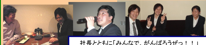
社長とともに「みんなで、がんばろうぜっ!!」