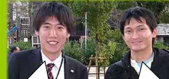
いえいえ、お疲れ様でした。