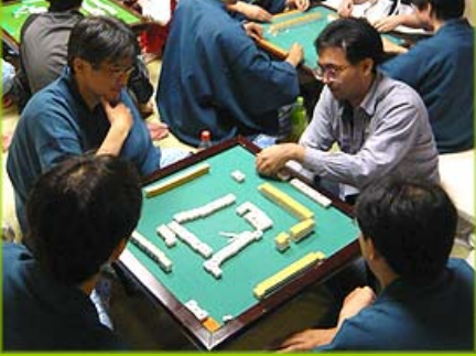
じゃらじゃらと男たちの夜は終わらない....