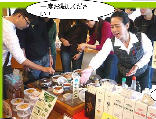
一度お試しください！