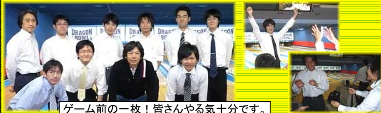
ゲーム前の一枚！皆さんやる気十分です。