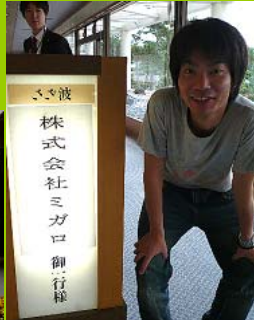
朝食も食べて2日目も楽しむぞ！