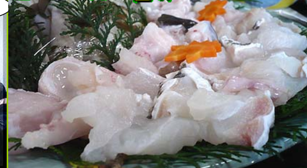
お腹が破裂寸前になるまでクエを食べつくしました！