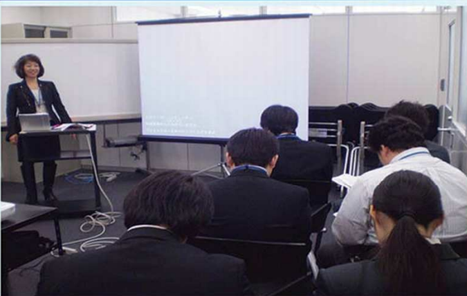
「20周年のミガロ、に期待の新人を！」

ミガロの20周年の年の採用活動ということもあり、ミガロ社員は新たな仲間に出会えることを心待ちにしています。 多くのメンバーが新卒採用に協力して、みんなで新メンバーを見つける活動をがんばっていきます！