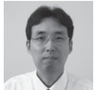
阪和興業株式会社 http://www.hanwa.co.jp/

独立系の老舗商社として、主力の鉄鋼や非鉄、水産物など各分野でシェアを伸ばしている。創業以来「流通のプロ」を基本理念に、高度な専門性と豊富なネットワークを活かし、グローバルに活動を展開している。