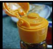
Push型ラー油

さあ、今月も「どっと放送局」より生放送でお届けいたします。 今回はミガロ、社内報「どっと」制作に関する秘話(?)がばんばん飛び出ております。 今月は八剣伝さんよりクリエイティブメンバー達の「生声」をお届けいたします。