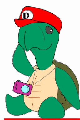
どっと特派員【デジ亀】 byピロピロ

【辻林】見られると緊張するので余り見ないで欲しいのですがどね。強いて挙げるなら、毎朝早めに出社しているところです。