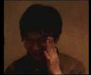
ミガロ、のガリレオ

みなさま、あけましておめでとうございます。 新年1回目のどっと放送局は少し装いを变更后、 2009年末に開催された「若手忘年会」の様子を お届けします!