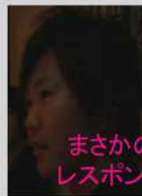
まさかの レスポンス