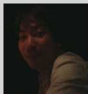
バレンタインを 楽しみに 2010年がんばる