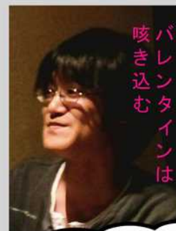
バレンタインは 咳き込む