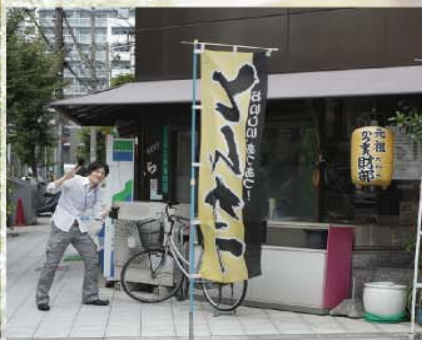
(お店の前でピースするやっくる特派員)