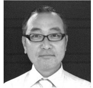
西川リビング株式会社 http://www.nishikawa-living.co.jp/

眠りから健康を創造し、より快適な暮らしを提案する西川リビング株式会社。時代のニーズに合わせた健康機能商品や新商品の開発を行っている。創業 1566 年の寝具・寝装品の製造卸業。